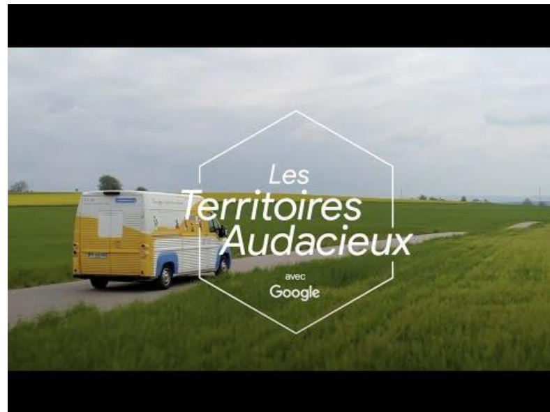
Les Territoires Audacieux, au cœur de l'Université de Picardie Jules Verne