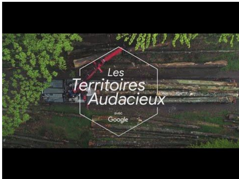
Les Territoires Audacieux, découvrez l'histoire de l'entreprise familiale Bois online